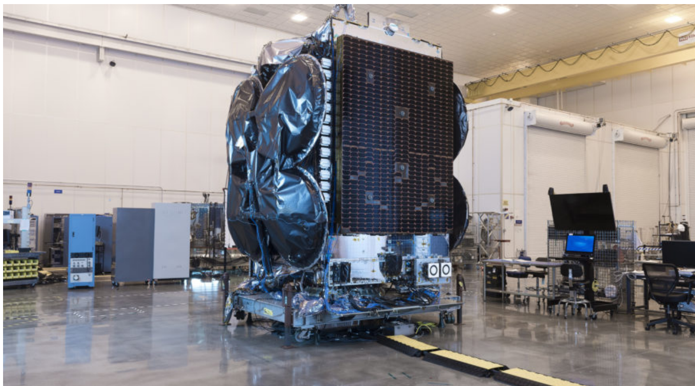
Orbital ATK Satelita Al Yah 3.

Wiadomo, że wobec niewłaściwego lotu Ariane 5 to repozycjonowanie zajmie arabskiemu satelicie dłużej, jednak nie wiadomo dokładnie jak długo. Właściciel Al Yah 3 nie ujawnił także, w jakim stopniu zużycie paliwa niezbędne do osiągnięcia GEO może wpłynąć na przewidywany okres eksploatacji tego satelity telekomunikacyjnego.