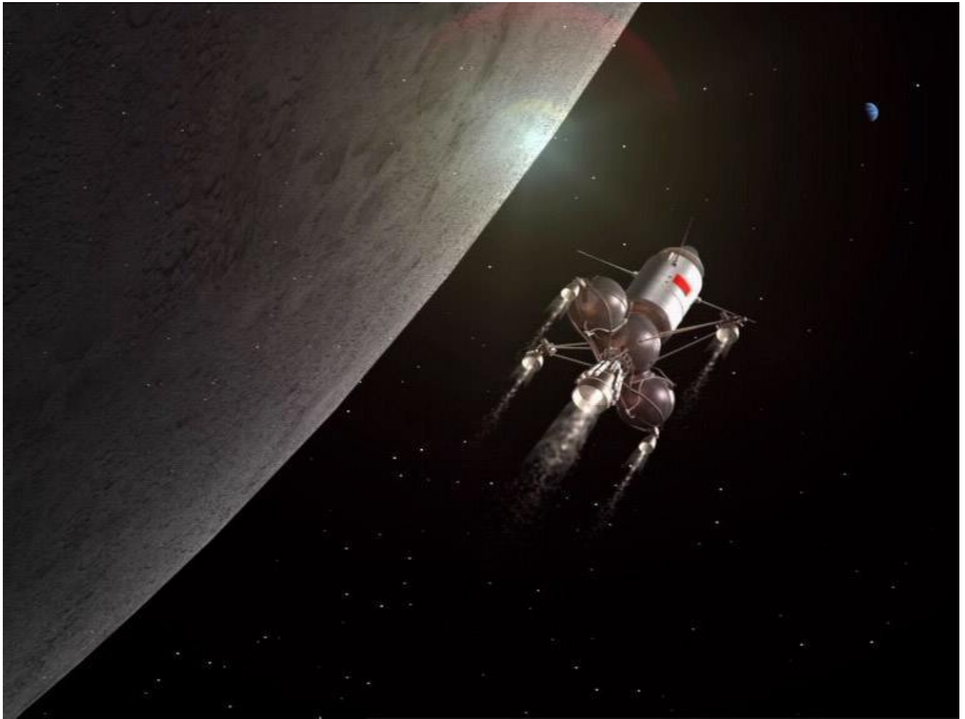
Ilustracja: CNSA [cnsa.gov.cn]

powiedzie, Chiny staną się trzecim państwem świata - po Stanach Zjednoczonych i Związku Radzieckim, które będzie miało na koncie takie dokonanie.