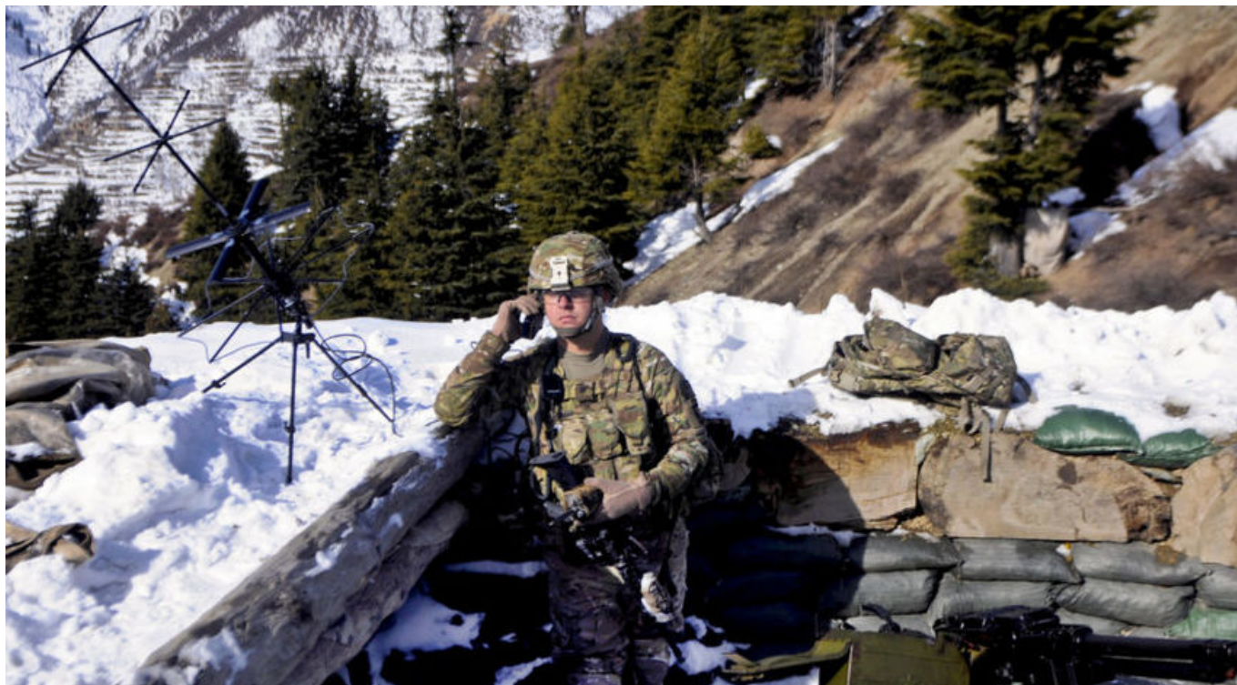
Terminal satelitalny wykorzystywany przez amerykańskiego żołnierza na granicy afgańsko-pakistańskiej.