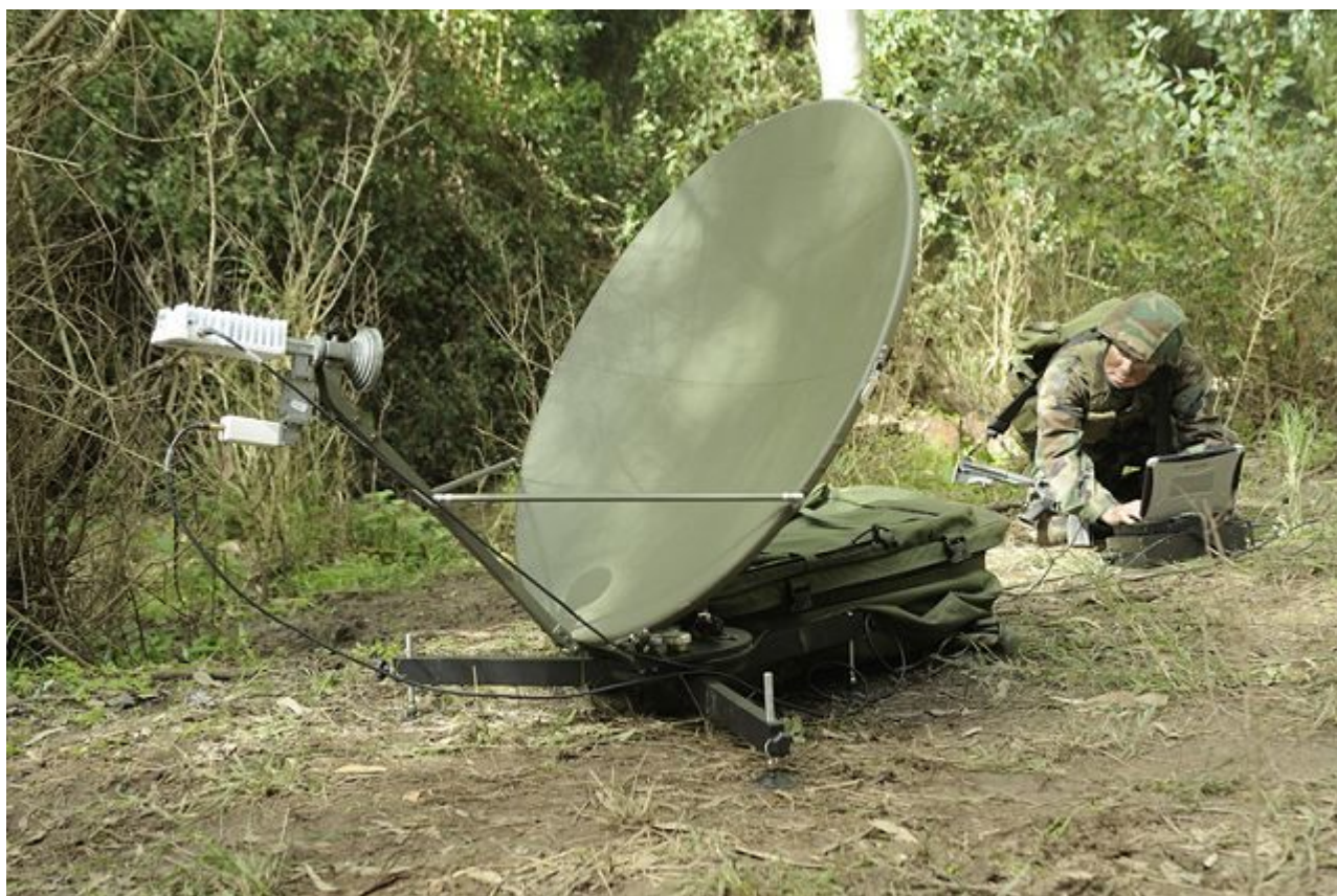
Rozłożony plecakowy terminal satelitarny Elbit MSR-3000.

Podstawa anteny ma pozwalać na ustawienie anteny w różnych warunkach terenowych i jej wypoziomowanie dla 10° pochylenia podłoża w kierunku na satelitę i równoczesnego 10° pochylenia prostopadłego do kierunku na satelitę. Natomiast głowica anteny ma dać możliwość (bez konieczności przestawiania podstawy anteny): regulacji kątowej w elewacji co najmniej od 10° do 85°, regulacji ruchu w zakresie azymutu przynajmniej 120° i regulacji kąta polaryzacji anteny w pełnym zakresie od 0° do 180°.