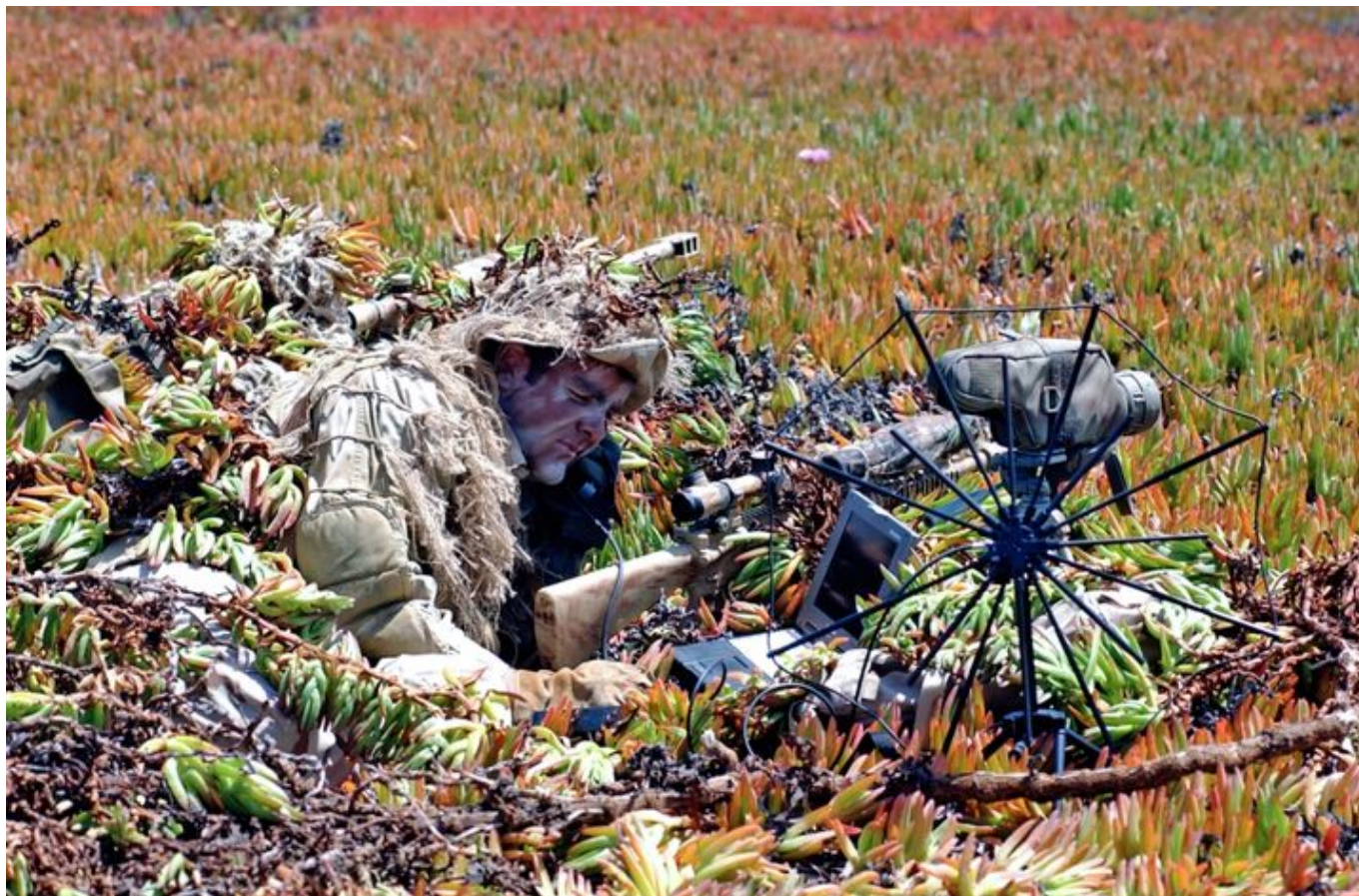
Terminal satelitarny wykorzystywany przez amerykańskich komandosów z Navy Seal.