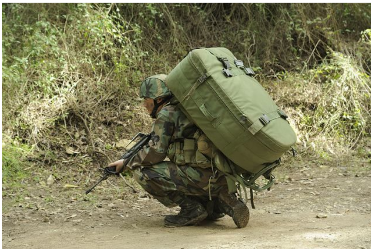
Spakowany w plecaku transportowym terminal satelitarny Elbit MSR-3000.

Każdy z dwóch plecaków transportowych wchodzących w skład jednego kompletu PTS ma być w innym kolorze (zielonym khaki, piaskowym, czarnym lub kamuflażu po uzgodnieniu wzoru) i mieścić cały Przenośny Terminal Satelitarny wraz z jednym z wybranych luster antenowych z zasilaczem i akumulatorem zapewniającym minimum 2 godziny pracy. Przy czym lustra i promienniki mają mieć indywidualny pokrowiec (z dodatkową, sztywną osłoną zabezpieczającą na czas transportu w przypadku promiennika).