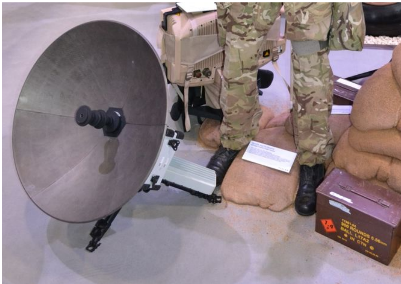
Plecakowy terminal satelitarny Tampa.

Oczywiście bardzo dobrze, że opisano ogólnie, co ma być przedmiotem zamówienia, ale wątpliwości budzi duża ilość informacji, jaką zawarto w opublikowanej dla wszystkich Specyfikacji Istotnych Warunków Zamówienia (w części III Opis przedmiotu zamówienia). Taki dokładny opis jest oczywiście przydatny – szczególnie, gdy nie wiadomo, jakie firmy wezmą udział w postępowaniu. Jednak w tym przypadku wyraźnie zaznaczono, że „dostarczone modemy muszą być wykorzystywane w siłach specjalnych państw NATO lub być następcą technologicznym modemów satelitarnych używanych przez Zamawiającego: IDU SkayWan ND SatCom serii 7000”.